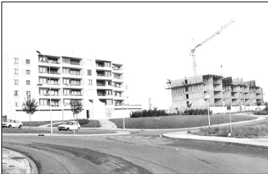
Construction de l'immeuble situé au 3 jardin Montreuil-Bellay (1982-83)