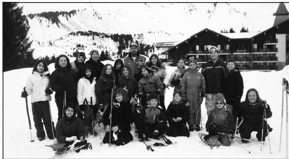
Première sortie en raquettes pour 20 enfants, partis à Cluses (74) du 3 au 10 avril.

Renseignements au Centre Social 28 rue de Chambord – 02.47.53.87.62